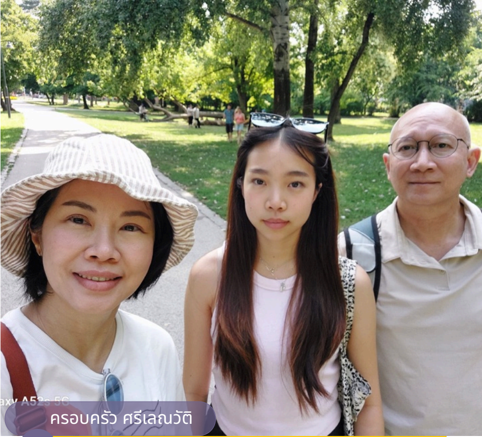
Galaxy A52s 5G