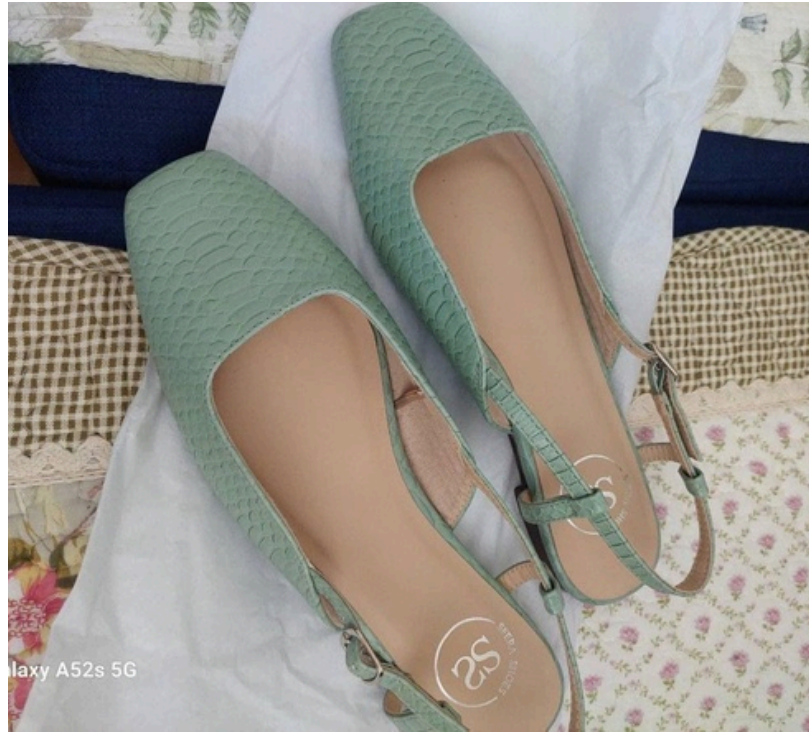
laxy A52s 5G

สำหรับฉันแล้ว ของทุกอย่างมีคุณค่าในตัวของมัน และ เราเป็นผู้กำหนดราคานั้นในใจของเราเสมอ ต่อให้สินค้าหนึ่งตัว ถูกตั้งราคาเอาไว้ที่ 100 บาท แต่ในใจของเรากลับคิดว่า มันดูไม่มีคุณค่าขนาดนั้น ราคา 100 บาท ก็ยังจะแพงเกินไปอยู่ดี