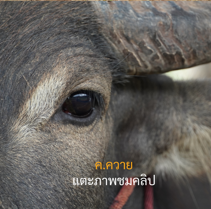
ค.ควาย ตะแคงภาพชมคลิป