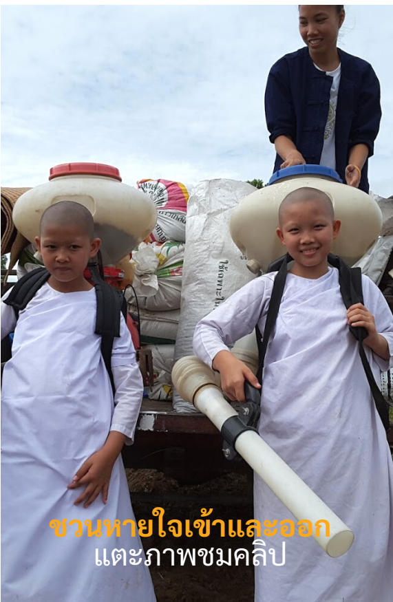
ชวนหายใจเข้าและออก แต่ะภาพชมคลิป

หากเรารู้ว่า ‘ลมหายใจ’ คือเครื่องมือที่มีอยู่ และสามารถพาให้เราพ้นทุกข์ได้ วิสาขบูชาปีนี้จึงเป็นโอกาสอันดีอีกครั้งที่จะเชิญชวนทุกคนให้กลับมาใช้ ‘ลมหายใจเข้าและออก’ ของเราอยู่บนวิถีแห่งสติ และใช้ความต่อเนื่องในการปฏิบัตินี้กลายเป็นพุทธบูชาาร่วมกัน เพื่อเป็นพลบปัจจัยให้ถึงการพ้นทุกข์ร่วมกัน