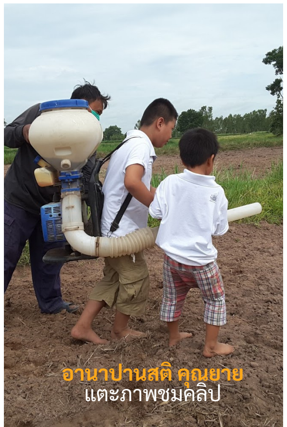
อานาปานสติ คณยาย แต่ะภาพชมคลิป