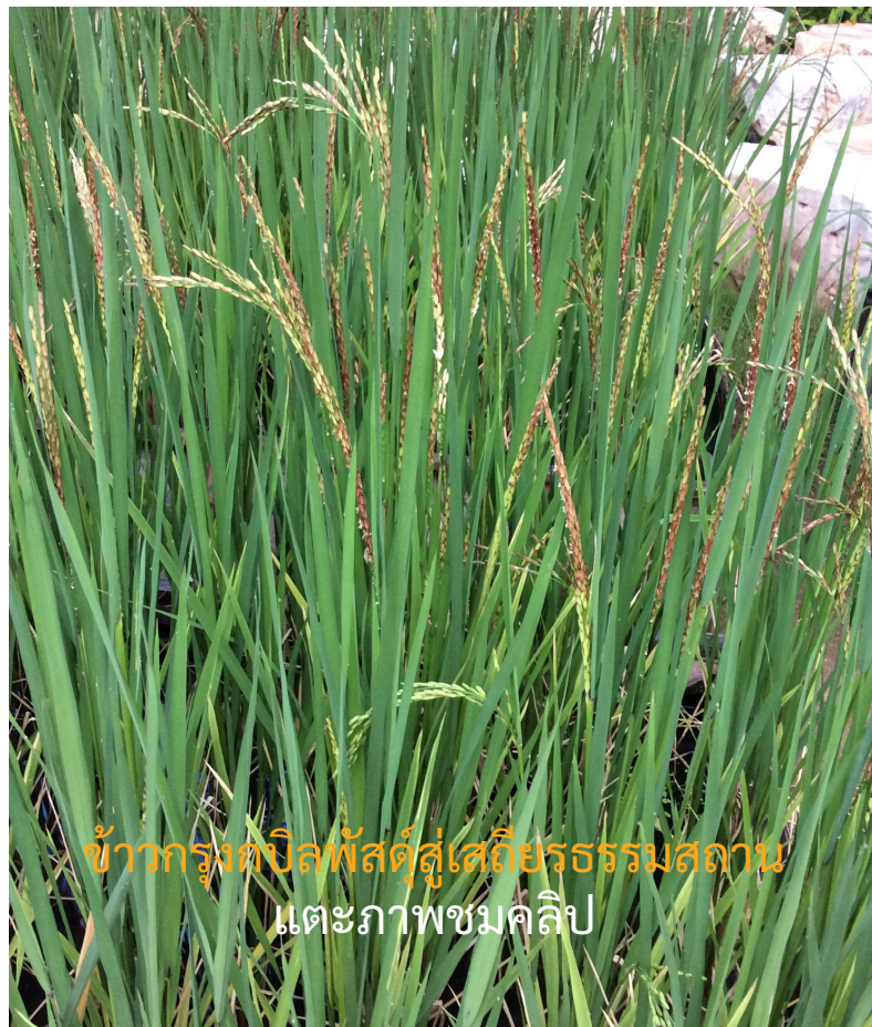
ข้าวกรังกบิลพัสดุ์สู่เสถียรธรรมสถาน ตะแตะภาพชมคลิป