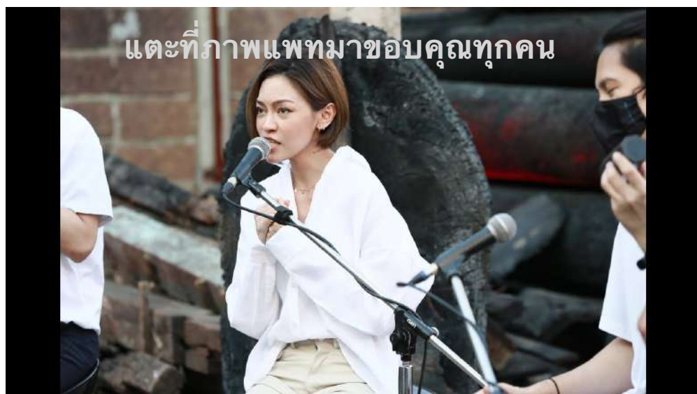
แต่ที่ภาพแพทมาขอบคุณทุกคน

ในการแสดงดนตรีท่ามกลางเวทีที่เป็นกองถ้ำถ่านในวันนี้ ไม่ได้มีแค่เพลงที่เพราะ แต่ยังมีหัวใจที่พร้อมที่จะลุกขึ้นมาแสดงธรรม คำสอนที่แพทและวงเคลียร์เคยได้ฟังที่ท่านอาจารย์คุณแม่ได้สอนไว้ “ไม่ทำงานด้วยความอยาก ไม่ทำงานด้วยความกลัว และสิ่งที่เราทำสามารถแสดงธรรมได้” เหตุการณ์ในวันแสดงคอนเสิร์ตจึงเป็น Spiritual Entertainment ความบันเทิงที่เป็นความสนุกสนานทางสติปัญญา การฟังดนตรีที่ทำให้คนตื่นรู้สู่การแบ่งปัน CARE SHARE RESPECT แม้ความบันเทิงจะจบลงแล้ว แต่ความมกงามทางสติปัญญายังคงเติบโตต่อไป