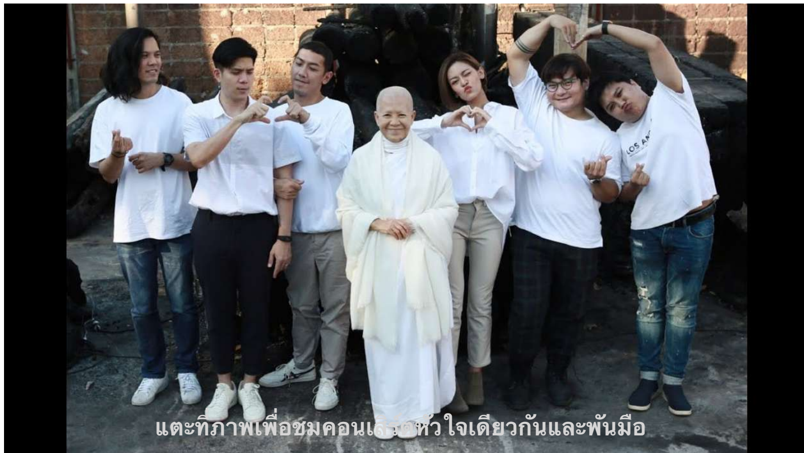
แต่ที่ภาพเพื่อชมคอนเสิร์ตหัวใจเดียวกันและพันมือ

สองประโยคนี้อยู่ในคลิปทั้งสองคลิปด้านบน ซึ่งสะท้อนให้เห็นเรื่องราวของความผูกพันที่ทั้งป้อมแป้มและแพทเห็นว่าเสถียรธรรมสถานเป็นประโยชน์ต่อผู้คน และเห็นว่าเสถียรธรรมสถานเป็นเหมือนบ้านหลังที่สองของคนทุกคน เมื่อบ้านเกิดไฟไหม้ ลูกจึงกลับมาช่วยกันสร้างบ้าน กลับมาร่วมกันเป็นหัวใจเดียวกันและพันมือ