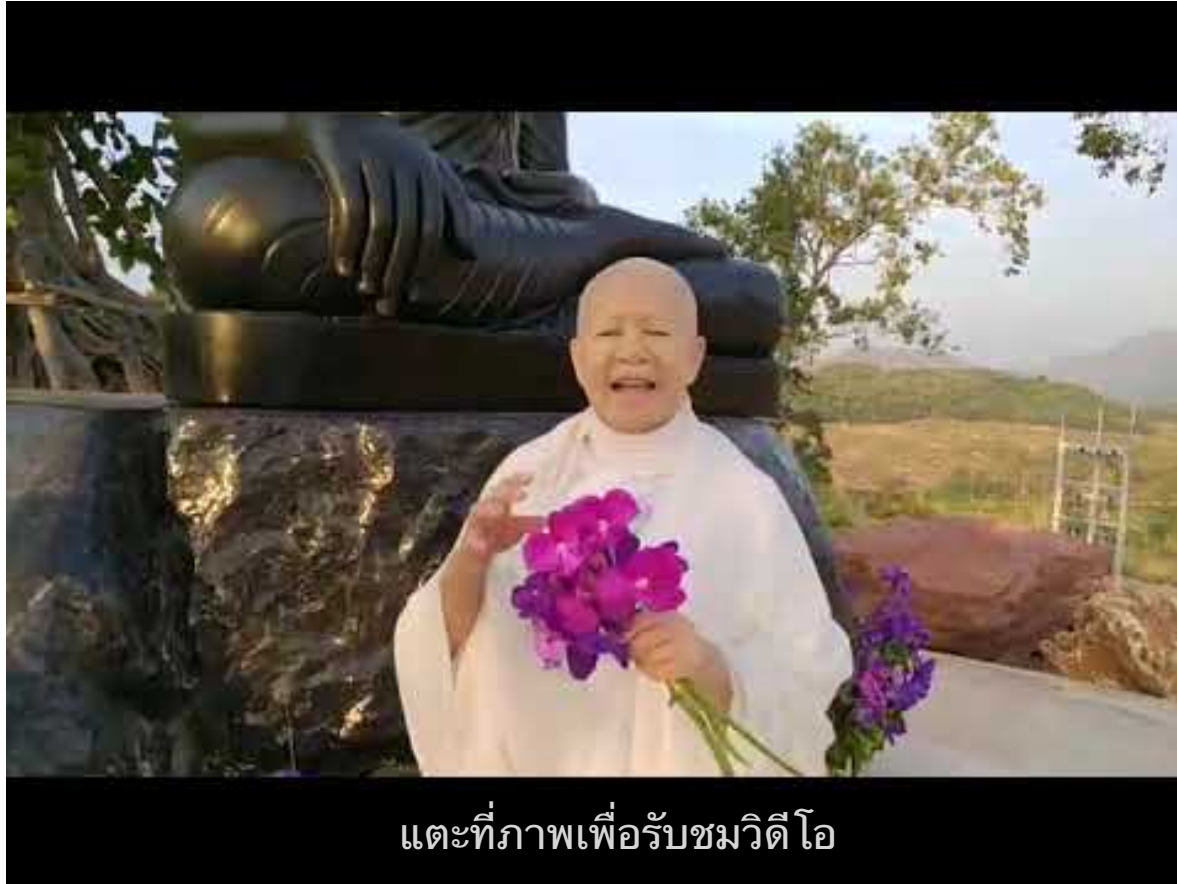
แต่ที่ภาพเพื่อรับชมวิดีโอ