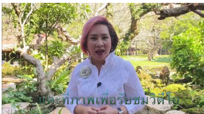
แต่ที่ภาพเพื่อรับชมวิดีโอ

พวกเรารู้สึกซาบซึ้งต่อทุกความปรารถนาดี ที่ทุกท่านมีมุทิตาจิต และก้าวเข้ามาเป็นเพื่อนร่วมทุกข์กับเสถียรธรรมสถาน ชุมชนแห่งการเรียนรู้ที่จะอยู่ร่วมกันอย่างสันติ และทุกการขอบคุณจากหัวใจจะอยู่ในหนังสือย่อยเล่มนี้ ‘เพื่อนร่วมทุกข์’ แต่ดูได้ที่ลิงก์นี้ นะเจ้าคะ https://shorturl.asia/em82W