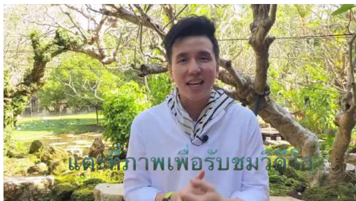
แต่ที่ภาพเพื่อรับชมวิดีโอ

และการเป็นสมาชิก ธรรมสวัสดิ์ e-Magazine ยังเป็นอีกหนึ่งช่องทางที่จะมาร่วมกันเป็นหัวใจเดียวกันและพันมือ เพื่อส่งต่อองค์ความรู้ในการนำธรรมะกลับมาสู่วิถีชีวิต ให้ขยายออกไปได้กว้างและไกลขึ้นผ่านทางสื่อสังคม Online